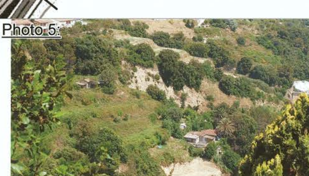
Eboulement et limons : Ravinement et Glissement