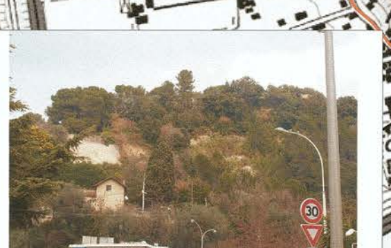
Formation des Poudingues : Ravinement et Eboulement