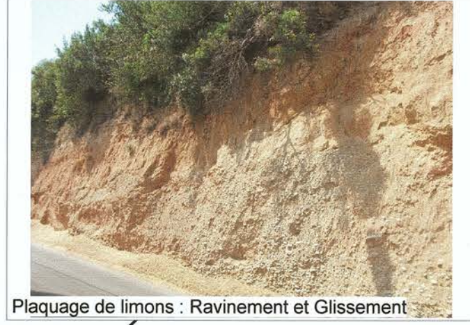
Plaquage de limons : Ravinement et Glissement