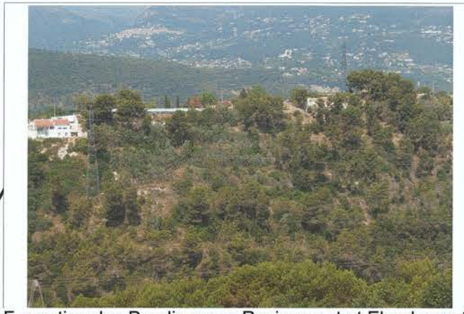
Formation des Poudingues : Ravinement et Eboulement