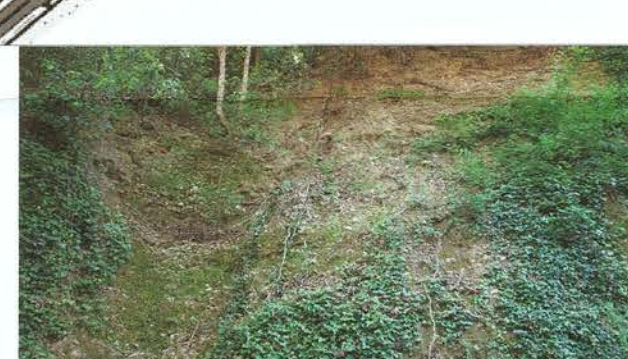
Formation des Poudingues : Ravinement et Eboulement