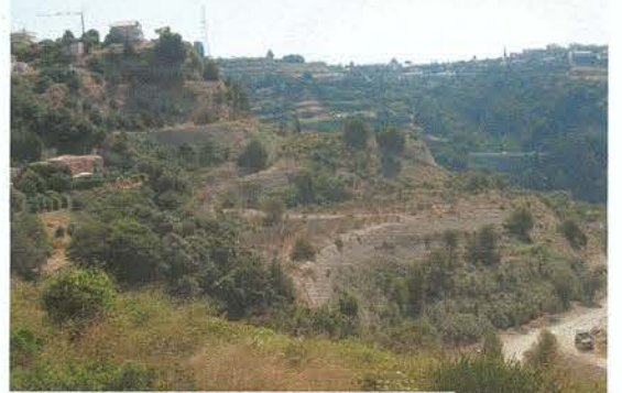
Poudingues et limons : Ravinement et Eboulement