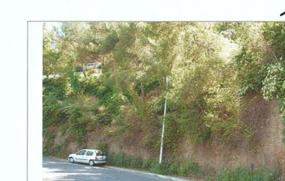
Formation des Poudingues : Ravinement et Eboulement